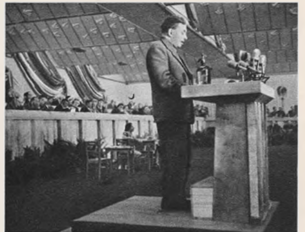
Выступление на Конгрессе известного советского писателя Ильи Эренбурга, избранного в состав Бюро Всемирного Совета Мира.