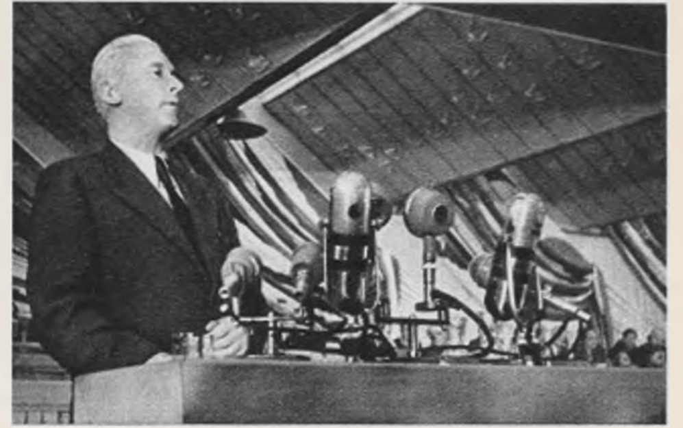
Выступление вице-председателя Бюро Всемирного Совета Мира генерального секретаря Союза советских писателей Александра Фадеева.

Пусть правительства действуют таким же образом, и дело мира будет спасено.