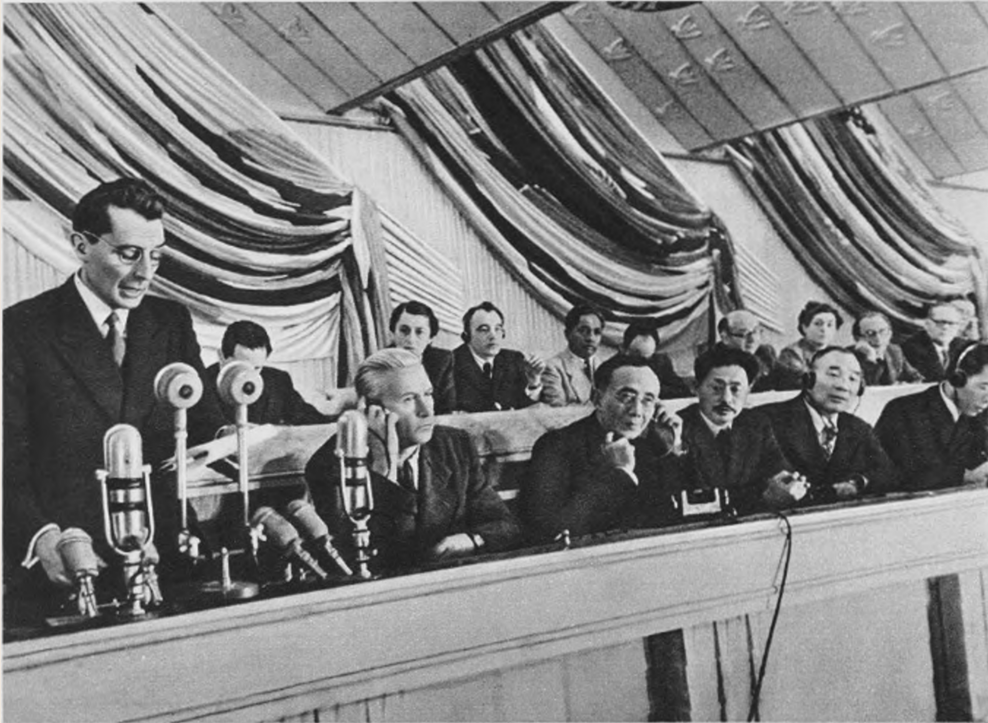
Открытие Второго Всемирного конгресса сторонников мира в Варшаве. Вступительное слово делает Фредерик Жолио-Кюри.