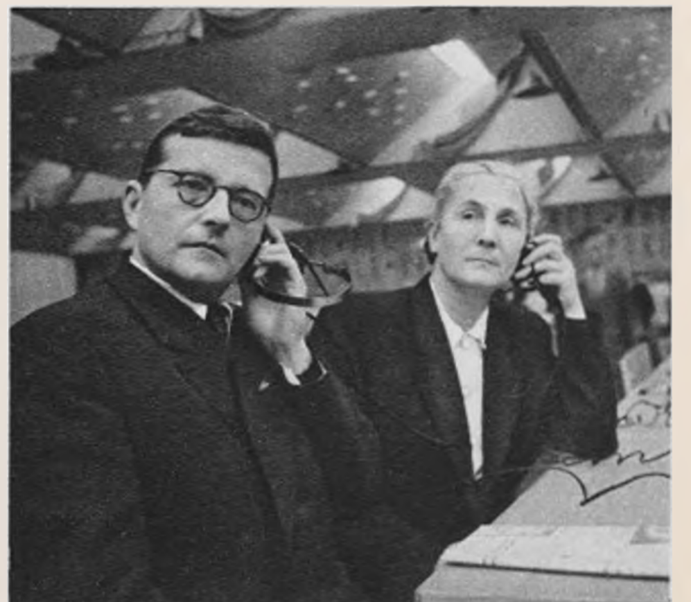
Члены советской делегации во время заседаний Конгресса. На снимке — композитор Д. Д. Шостакович и мать двух погибших прославленных героев второй мировой войны Л. Т. Космодемьянская.